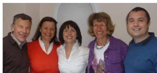
Die Balanced Life Crew

Wir helfen Ihnen sich BEWUSST zu werden - wie Sie IHR Leben in BALANCE BRINGEN oder HALTEN können!